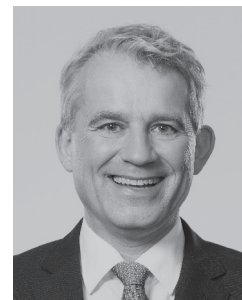
Beat Jans Regierungspräsident Kanton Basel-Stadt